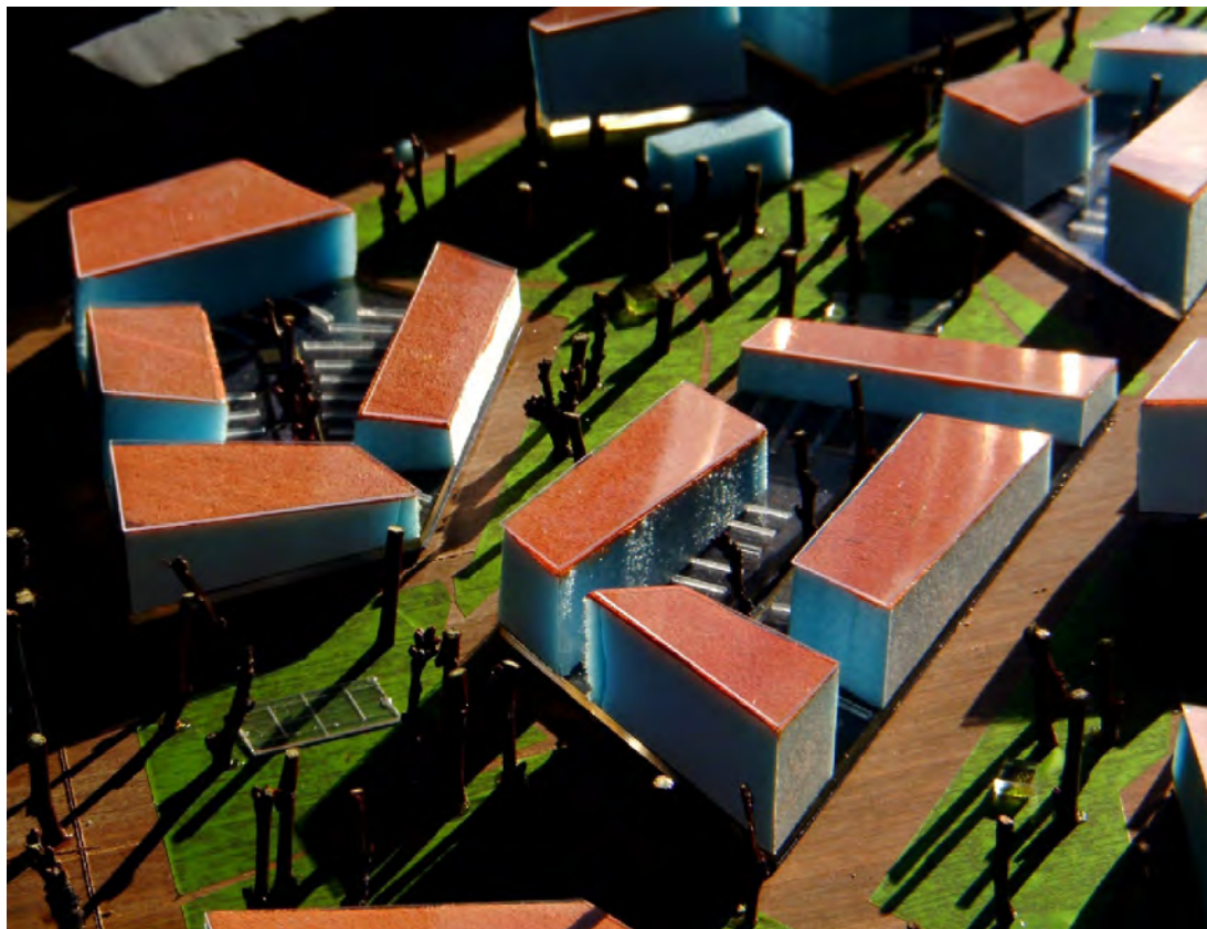
Nuovo quartiere CasaNova. Veduta del plastico. (Architekten Cie.).

Il progetto di Oltreisarco, OHA, varato in riferimento ai protocolli metodologici di Agenda 21 per la riqualificazione integrata, è divenuto così intervento sperimentale di azione diretta, partecipata, integrata e politematica su una realtà territoriale omogenea.