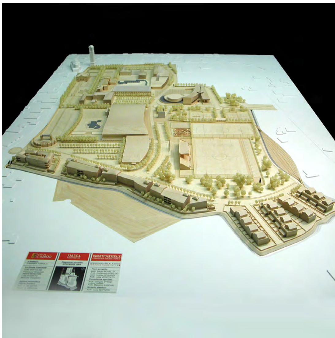
Plastico della trasformazione prevista dal Programma integrato per la riqualificazione urbanistica, edilizia ed ambientale "Caldogno - Parco urbano"

Infatti, il valore dei beni comunali da cedere a titolo di contributo, stimato in 7.641.555,00 Euro (oltre allo scomputo degli oneri di urbanizzazione secondaria, calcolati approssimativamente in 680.000,00 Euro), è prevalentemente determinato dal plus valore acquisito dalle aree destinate alla realizzazione di residenze private ed attività commerciali, per effetto del loro inserimento nel Programma integrato; aree acquistate dal Comune a prezzi circa dieci volte inferiori. Il contributo comunale consiste, inoltre, nel trasferimento al concessionario di un edificio fatiscente conosciuto come "ex ospedale", il cui recupero avrebbe richiesto all'Amministrazione una spesa stimabile in almeno 5.000.000 di Euro.