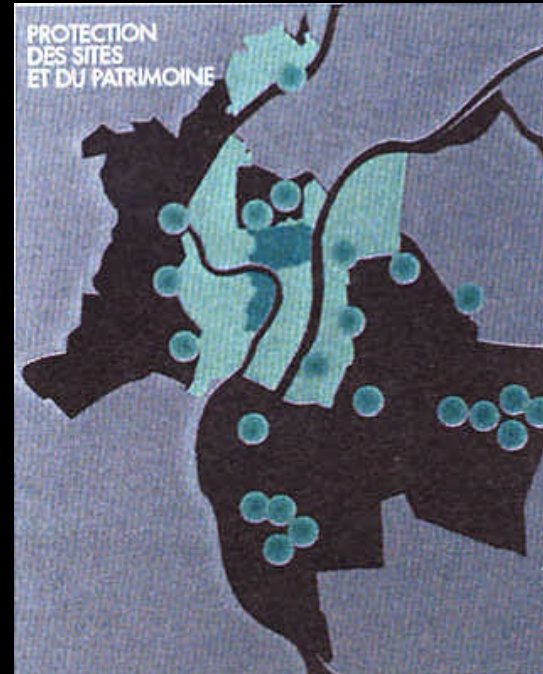
Plan de protection du patrimoine architectural urbain et paysager