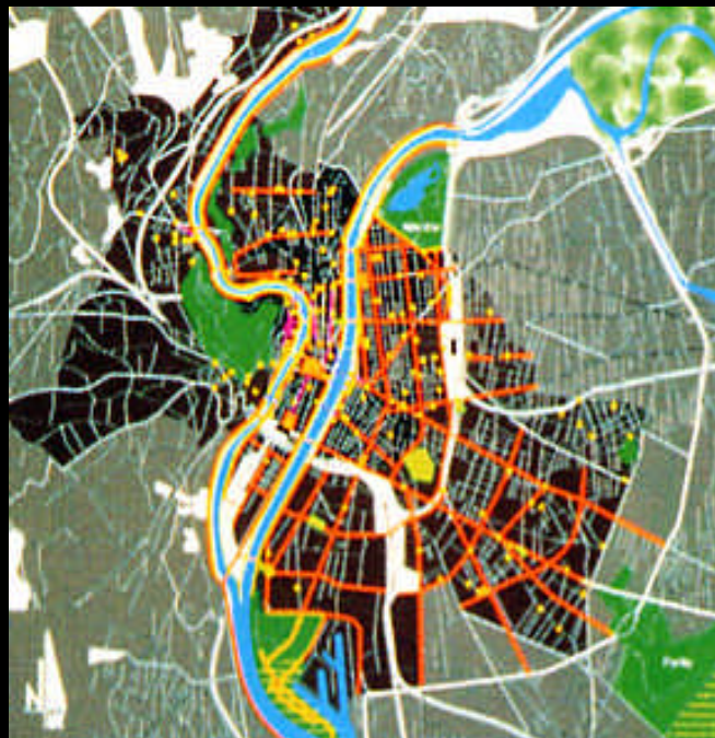
Schéma d'aménagement des espaces publics