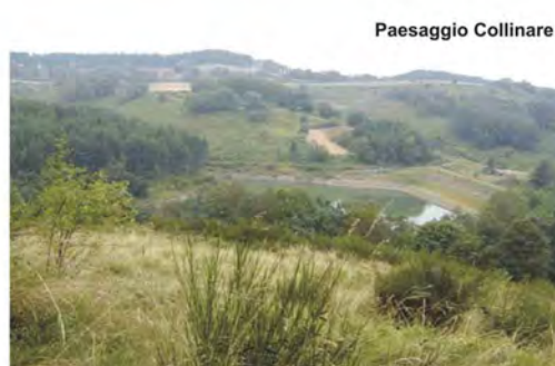
Tipi di paesaggi – repertorio fotografico.