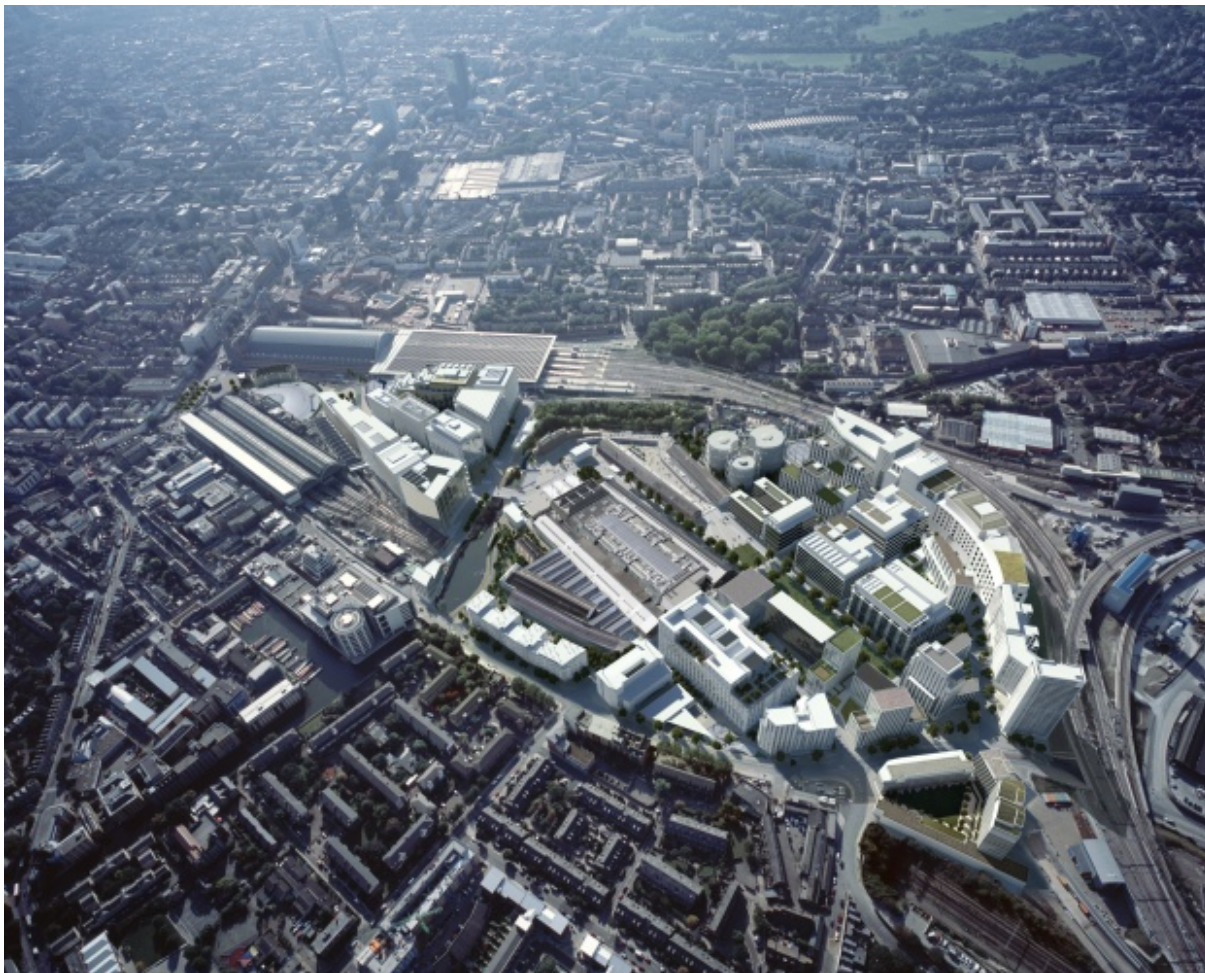
Figura 1. La trasformazione di King's Cross Central.

King's Cross Central è il risultato di una serie di complesse e continue interazioni che si stabiliscono, in maniera sia orizzontale che verticale, tra differenti soggetti pubblici e privati, interazioni che dunque vanno a costruire un processo altamente dinamico che corrisponde al vero oggetto di questa analisi.